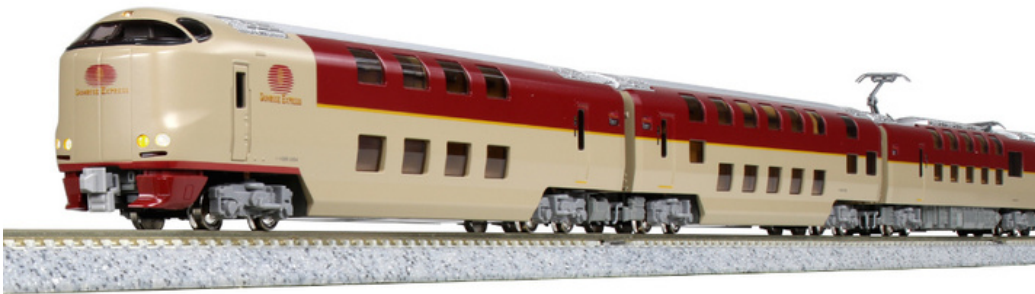
K10-1565 Series 285-3000 Sunrise Express Set básico 7 coches

La popular serie 285 Sunrise Express, que conecta Tokio, Takamatsu en Shikoku e Izumo en la prefectura de Shimane, se actualiza a una nueva versión con pantógrafo .