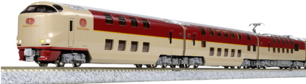
K10-1564 Series 285-0 Sunrise Express Set básico 7 coches