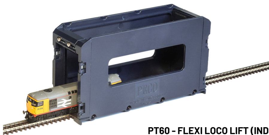
PT60 - FLEXI LOCO LIFT (INDIVIDUAL)

Cada Flexi Loco Lift se suministra con dos puertas deslizantes, para asegurarse de que no se caiga la locomotora durante el transporte, y que se recortan para adaptarlas a la galga/escala seleccionada.