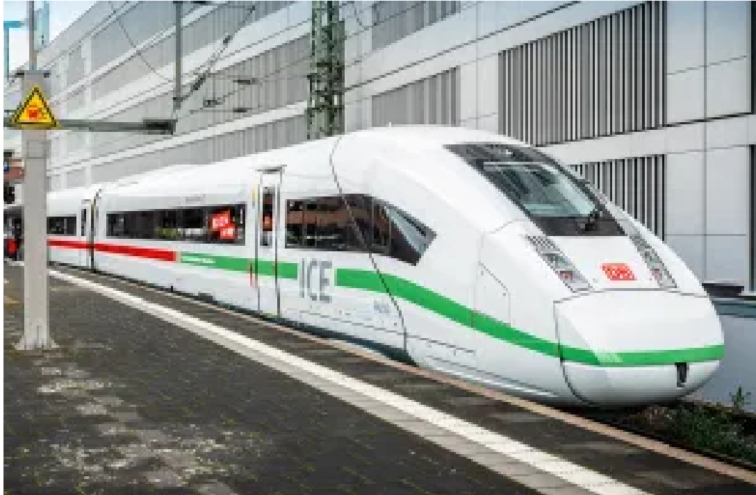
Tren de alta velocidad Deutsche Bahn

K10-1542 ICE4-DB (Línea Verde) Set básico 4 coches