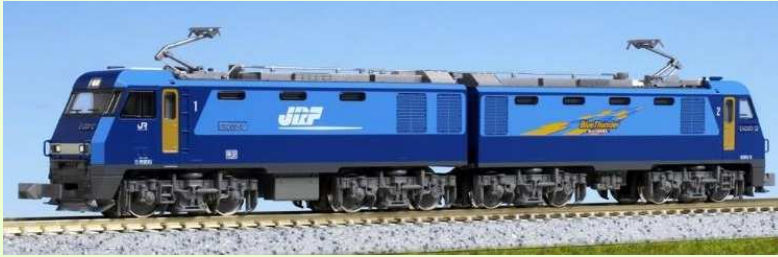
3045-1 Electric Loco. EH200