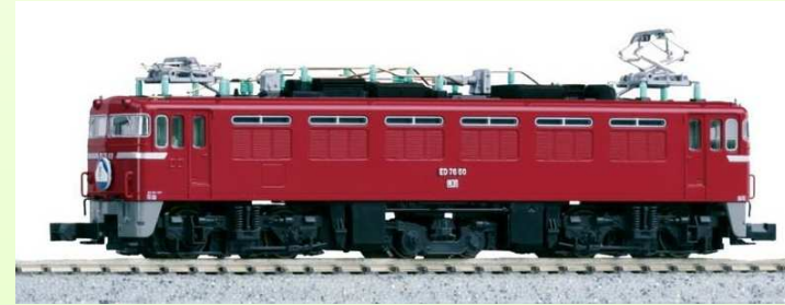
3013-1 ED76 0 Late Stage