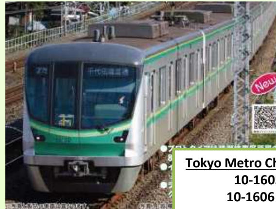
Tokyo Metro Chiyoda Line 16000 (5th Train) 10-1605 Set básico 6 coches 10-1606 Set adicional 4 coches