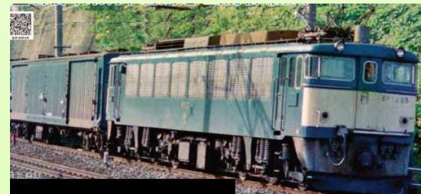
3058-3 Electric Locomotive EF62 Late Stage Shimonoseki