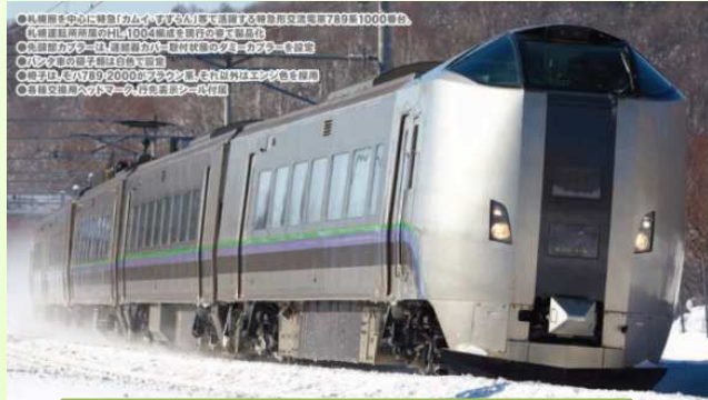
10-1210 Set 5 coches, Serie 789-1000 "Kamui/Suzuran"