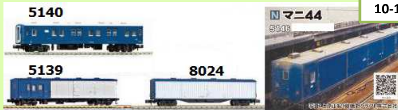
10-1590 Set 6 coches Post Cargo Train "Tokaido / Sanyo"