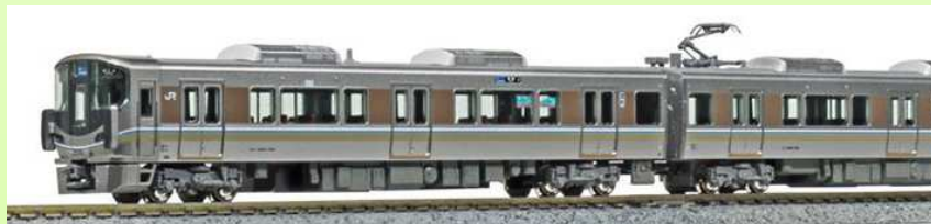
10-1439 Set 8 coches, Serie 225-100 "Shinkaisoku" 10-1440 Set 4 coches, Serie 225-100 "Shinkaisoku"