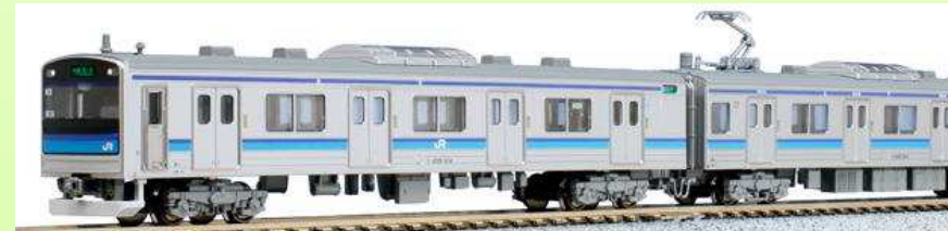
10-294 Set 4 coches, Serie 205-3100 Senseki Line