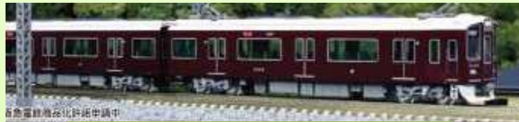
Hankyu Railway Series 9300 Kyoto Line 10-1365 Set básico 4 coches 10-1366 Set adicional 4 coches